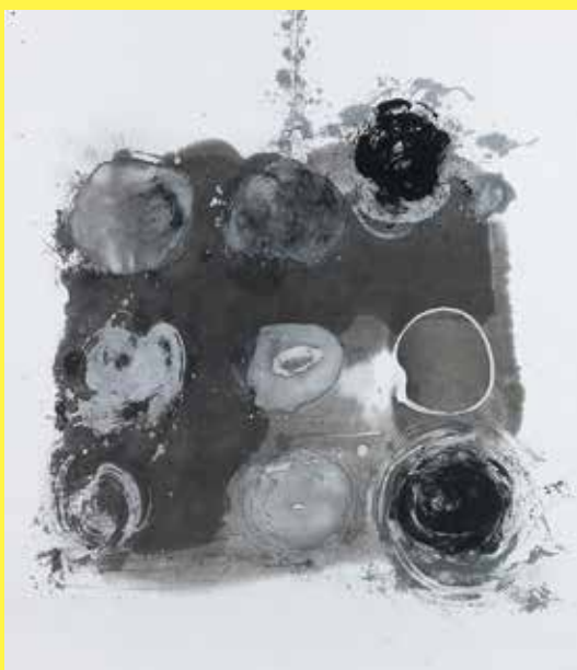
「日々刻々 J」和紙に墨 99×85cm