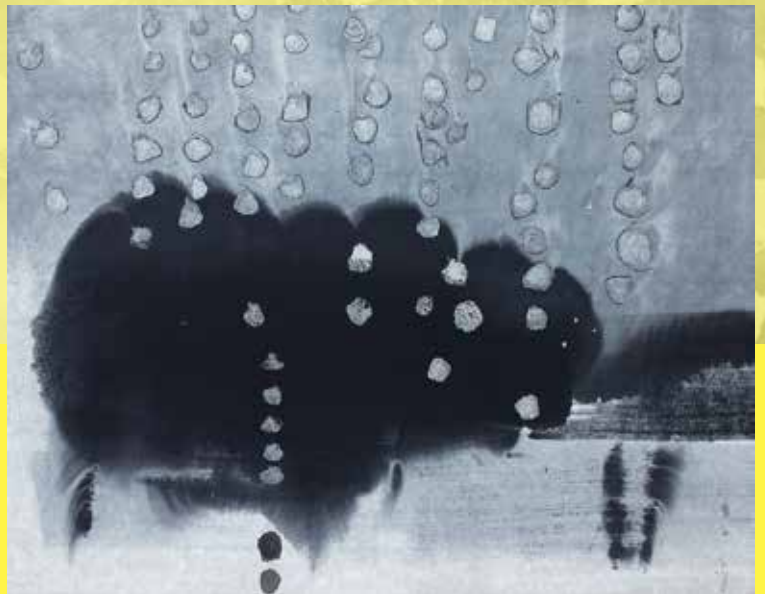
「日々刻々 BB-1」和紙に墨 72×93cm

無限に広がる墨色におもいを託し、日々刻々と過ぎゆく時間と一瞬に潜む墨のかたちを描く荒井恵子。百種類の異なる墨を使い、三代目岩野平三郎製作所や重要無形文化財の保持者（人間国宝）である岩野市兵衛氏が漉く和紙に、墨色が交わり奏でるハーモニーを表現しています。2018年には、紙祖神岡太神社・大瀧神社1300年大祭・御神忌を記念して襖絵を制作し、その後、卯立の工芸館、篠田桃紅美術空間、富山県立水墨美術館で個展が開催されました。にじみやぼかし、余白の美といった伝統的な技法と革新的な表現は、見るものの心に翼を与え、雄大な世界へと誘います。