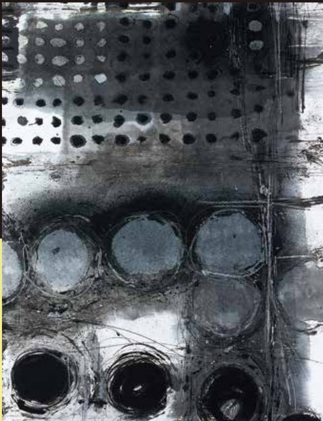
「日々刻々 56-A」和紙に墨 113×87cm

「100種類の墨を毎日毎日磨っていたら、いつの間にか無心になり呼吸のリズムが聞こえてきました。」