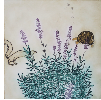
鶴留尚子 Si je partage ta langue もし君と言葉を分かち合うなら・・・ 40×40cm

[返選先] ISETAN MITSUKOSHI HOLDINGS 〒104-8212 東京都中央区銀座4-6-16 銀座三越内