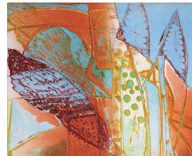
石田都紀 un jour joyeux 幸せの日 39.5×49cm