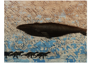
山本寛子 Cry 鳴く 30×41cm